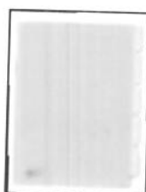
Figura N° 3

Incluir separadores identificados con el nombre del documento que antecede (en forma impresa, o manuscrita en letra legible) ( Figura N° 3 ).