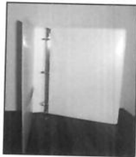
Figura N° 1

El expediente debe ser presentado en una Carpeta color blanco, tamaño carta, de tres aros, de 2 pulgadas de grosor, con funda plástica. (Figura N° 1)